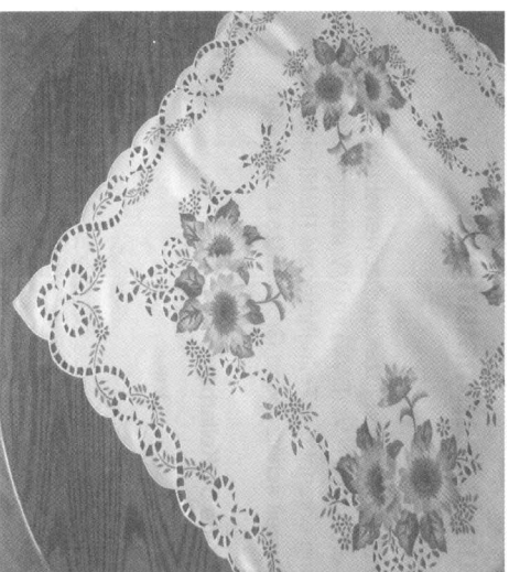
WF Höchststadt a.d. Aisch

Veranstalter: Wanderfreunde Höchststadt/ Aisch e.V.